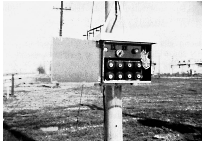
Bild 1: Einer der ersten kathodischen Schutzgleichrichter in den USA, 1928

Um 1928 hatte R.J.Kuhn dem kathodischen Schutz von Rohrleitungen zum Durchbruch verholfen. Er hatte 1928 in New Orleans umfangreiche Untersuchungen an Nieder- und Hochdruckleitungen durchgeführt und durch experimentelle Forschungen bei der Elementbildung von verschiedenen Rohrleitungsstücken im Boden festgestellt, dass bei Erreichen des kathodischen Schutzpotenzials von U_{Cu/CuSO_4} = -0,85 \text{ V} keine Elementströme mehr auftreten. Daraus folgerte er, dass bei diesem Potenzial ein vollständiger kathodischer Korrosionsschutz für die Rohrleitungen erreicht sei. Diese richtige Schlussfolgerung wurde später in umfangreichen Arbeiten über die Potenzialabhängigkeit der Korrosionsgeschwindigkeit bestätigt. In einer der ersten Arbeiten über den kathodischen Schutz (s. Bild 1) schrieb Kuhn: „Einige Gebiete in New Orleans liegen unter dem Meeressniveau, andere dagegen einige Meter über dem Meeresspiegel. Ein großer Teil des Gebietes besteht aus alten Zypressensümpfen, die trockengelegt und erschlossen wurden. Vorherrschend sind es salzige und säurehaltige Böden, die sehr aggressiv sind. New Orleans