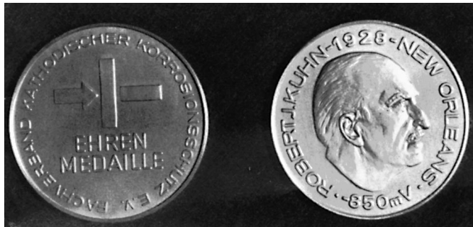
Bild 2: Kuhn-Ehrenmedaille für Verdienste auf dem Gebiet des kathodischen Korrosionsschutzes.